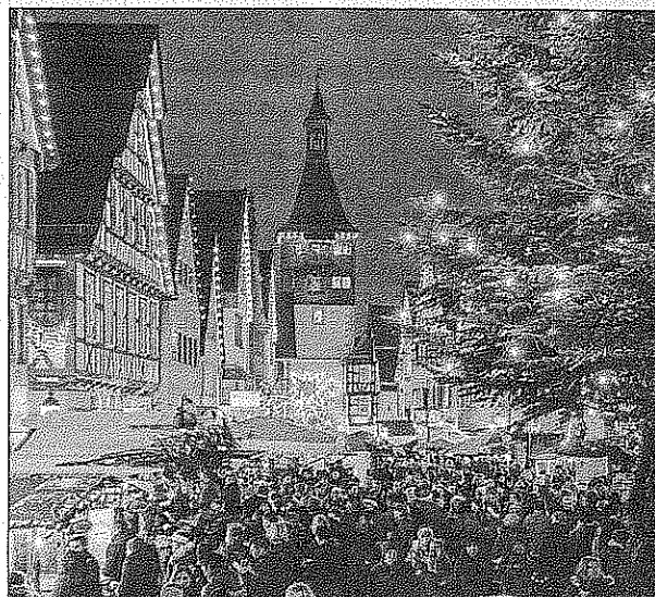
Der Winnender Weihnachtsmarkt bildete zum 31. Mal den Kern der Winnender Weihnacht.